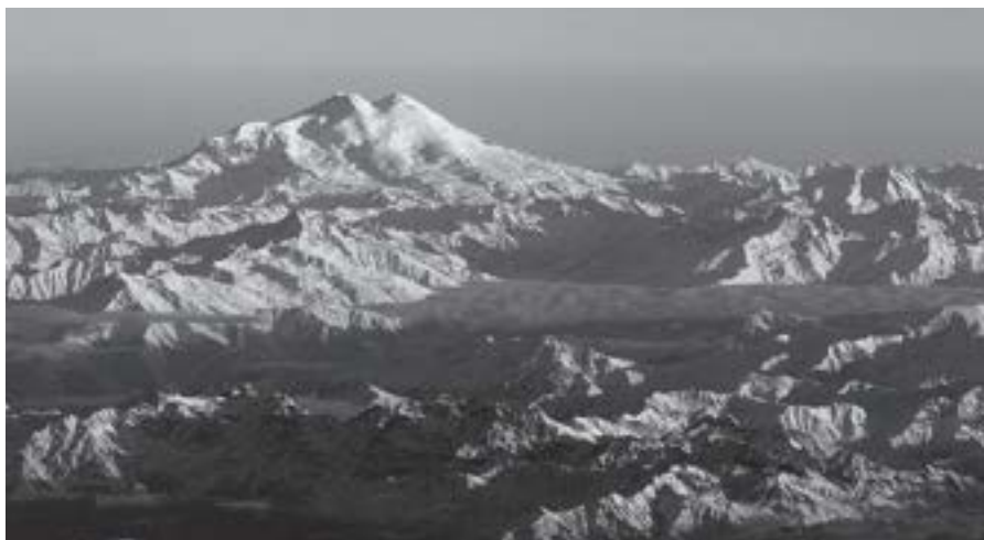
▲ Elbrus widziany z południa.

W książce Elbrus jest traktowany jako część Europy. Problematyka jego przynależności kontynentalnej została omówiona na s. 18–19.