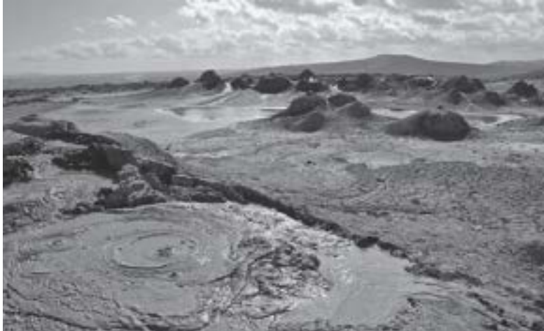
▲ Wulkany błotne w Qobustanie (Azerbejdżan).