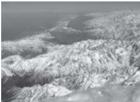
▲ Wielki Kaukaz.