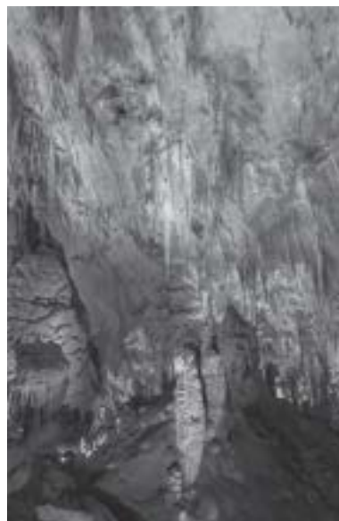
▲ Jaskinia Prometeusza (Gruzja).

Znaczna część Kaukazu Północnego, Wyżyny Armeńskiej, Niziny Kurańskiej i Półwyspu Apszerońskiego pokryta jest terenami półpustynnymi i stepami. Na południe od