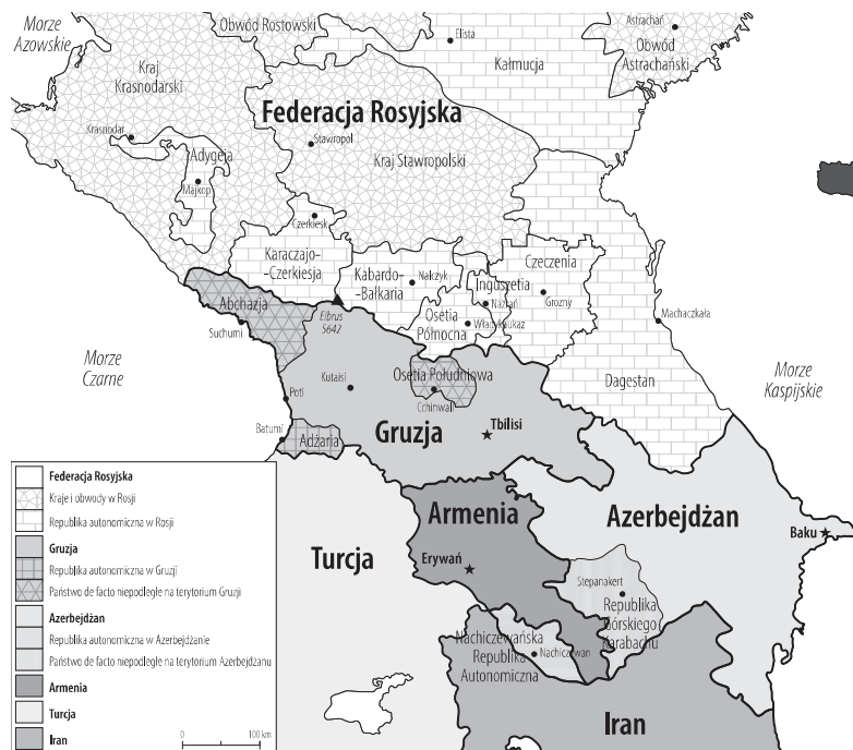
▲ Mapa polityczna Kaukazu

poematu Tarasa Szewczenki, potoczną nazwą owczarka kaukaskiego, starożytne określenie Hindukuszu czy oznaczenie jednego z pasm górskich na... Księżycu. Rozbieżności zdań dotyczące czterech wypunktowanych definicji zostaną omówione w kolejnych rozdziałach.