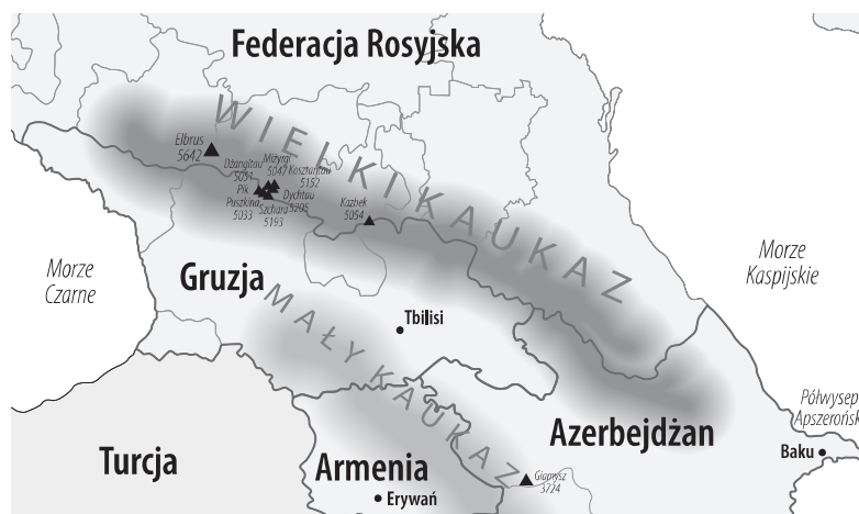
▲ Mapa topograficzna Kaukazu

WWF z kolei definiuje Kaukaz jako ekoregion i zalicza do niego także część północno-zachodniego Iranu oraz północno-wschodniej Turcji. Według tego podejścia jego obszar wynosi 580 tys. km 2 . Tak ujęty Kaukaz określa jako jeden z 25 najbardziej zróżnicowanych pod względem biologicznym ekoregionów na świecie 8 .