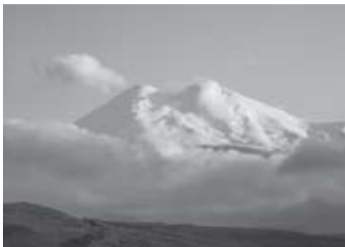
▲ Elbrus – widok z północy.

Elbrus. Nie tak popularny jak Kilimandżaro, niższy od niego – choć zaledwie o 253 m – przykuwa uwagę od tysięcy lat. Interesował starożytnych Greków, dziesiątki lokalnych kultur, dziewiętnastowiecznych pionierów wspinaczki w Kaukazie, hitlerowców i Sowietów – ci ostatni nadali mu rangę symbolu. Fascynuje współczesnych