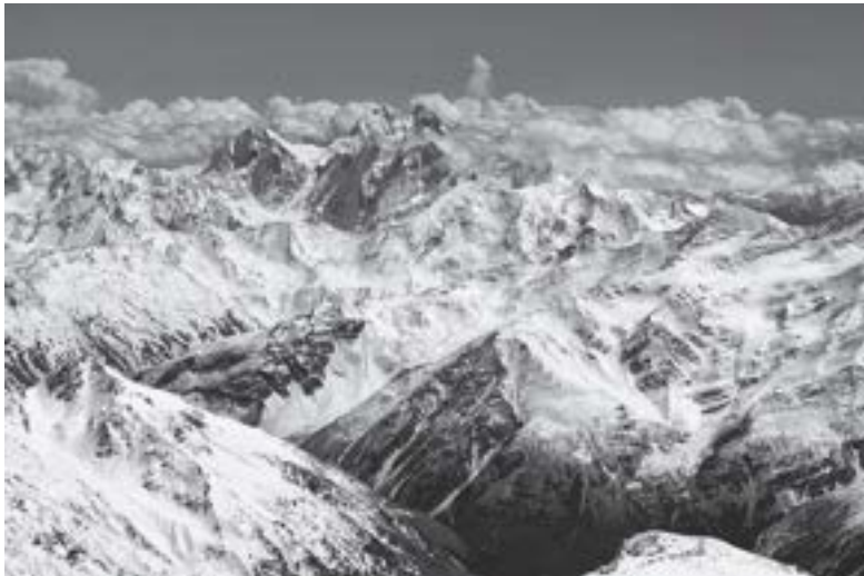
▲ Wielki Kaukaz. Uwagę przyciągają dwa charakterystyczne wierzchołki Uszby.