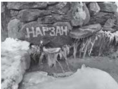
▲ Źródło w dolinie Baksan.