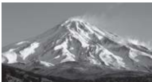
▲ Demawend. Najwyższy szczyt gór Elburs.

Na północ od Wielkiego Kaukazu położony jest Kaukaz Północny (Przedkaukazie).